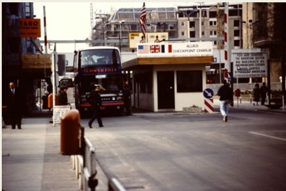
Checkpoint Charlie, set fra Vestberlin. Man ser de allieredes flag.

Checkpoint Charlie, så vi på begge sider af Berlinmuren.