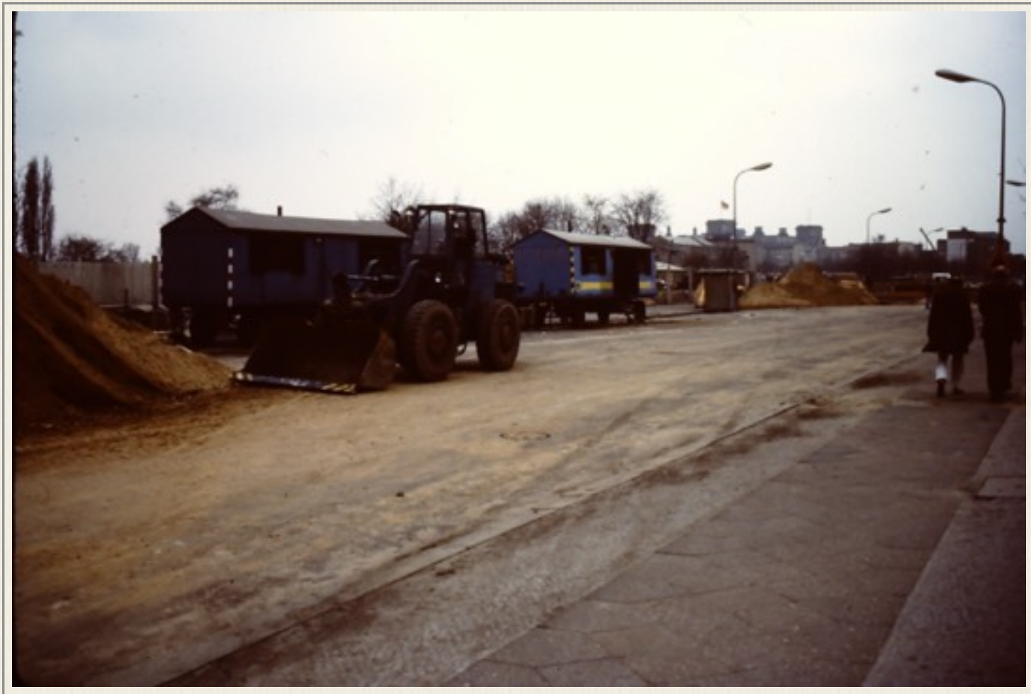
Gravearbejde i førerbunkerens område ved Wilhelm Straße i 1987 i Østberlin. I baggrunden ses Rigsdagen med flaget.

Vi gik derhen i 1987. Vi så, der var gravearbejde i gang, der skulle lægges fjernvarme, fortalte en af arbejderne os. Vi spurgte om de fandt noget specielt? Han fortalte med sænket stemme og fakker, at de blev overvåget af DDRs politi, og når de fx fandt guld måtte de desværre aflevere det. Denne østtyske arbejder var ikke uden humor, og det var han ikke ene om. Vi mødte i Østberlin på gaderne og på museerne mange venlige mennesker. I Vestberlin var de mere "hektiske".