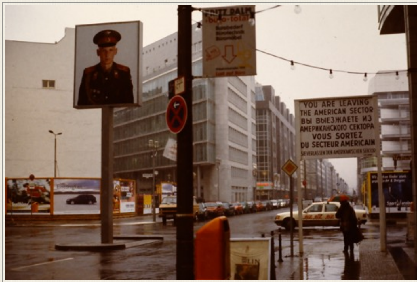
Ved det tidligere Checkpoint Charlie i 1999, efter Berlinmurens fald.