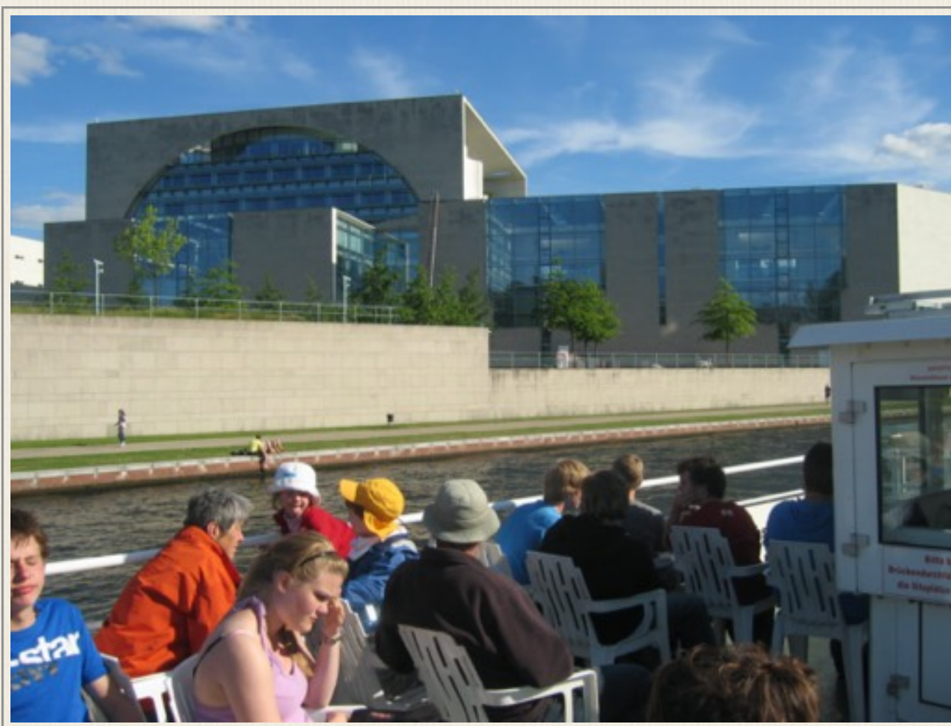
Bygning til forbundskansleren og dennes stab i Berlin. Det er den store bygning med det store runde vindue, fotograferet i 2010. Tyskerne kalder bygningen for ”den store vaskemaskine”, det ligner den jo også.