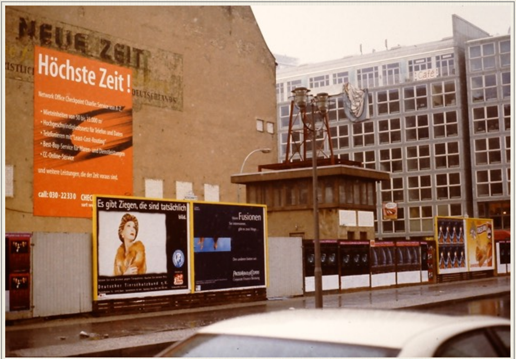
Ved det tidligere Checkpoint Charlies område i 1999, efter murens fald.