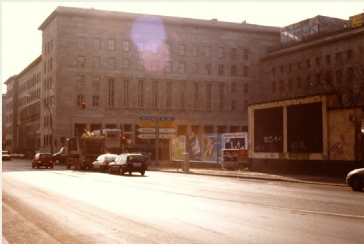
Bygningskomplekset i 1999. De østtyske faner er væk.

Efter genforeningen blev det her, at Treuhand organisationen skulle få ordning på genprivatiseringen af statsejendommene i DDR. Det er her Detlev Rohwedder navnet kommer ind i billedet. Han var leder af Treuhand-organisationen, indtil han blev myrdet i 1991. Mordet er aldrig blevet opklaret. Han mindes nu med, at bygningen bærer hans navn.