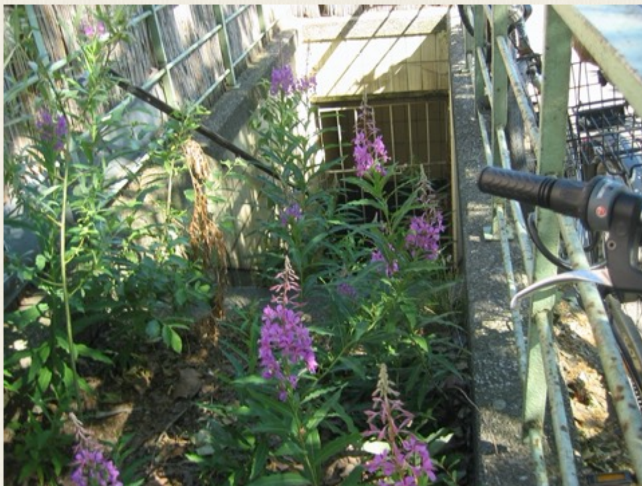
Foto taget i 2010 af et offentligt kældertoilet i Østberlin, som vi kendte fra 1987. Ak, hvor forandret. Man havde ladet det forfalde og gro til.

Det var et offentligt kældertoilet i Østberlin, som vi ofte benyttede, vi syntes det var et udmærket toilet.