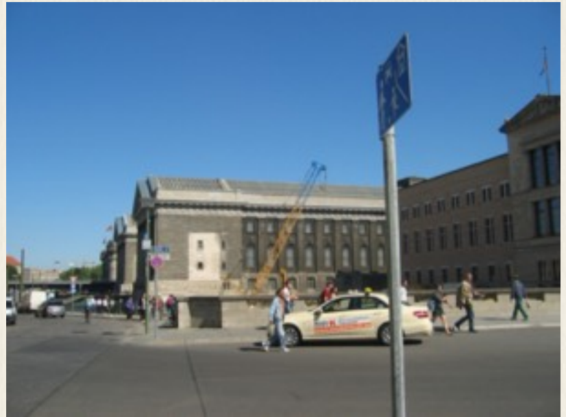
Her er Neues Museum efter genopbygningen, som vi så det i 2010. Det er bygningen til højre for fodgængerskiltet. Læg mærke til den trekantede gavl yderst til højre på toppen af museet med flaget på toppen, og det der er lige neden under den, det er den samme type gavl og vinduer, som vi ser på billedet fra 1987, hvor museet ligger i ruiner.

Til det nyrestaurerede Neues Museum har man fra Altes Museum flyttet “publikums magneten” Nefertiti-busten .