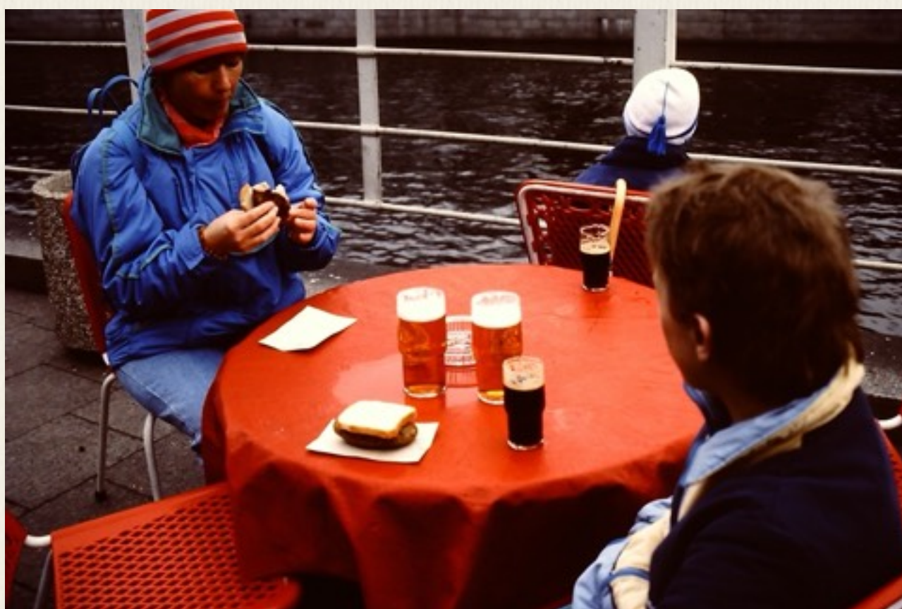
Pause ved floden Spree.

Tid til pause på gåturen. Øl, pølser og sodavand var meget billige, og af god kvalitet. Der var ikke engangsembalage, men pant på drikkeglassene, meget økologisk og klimavenligt.