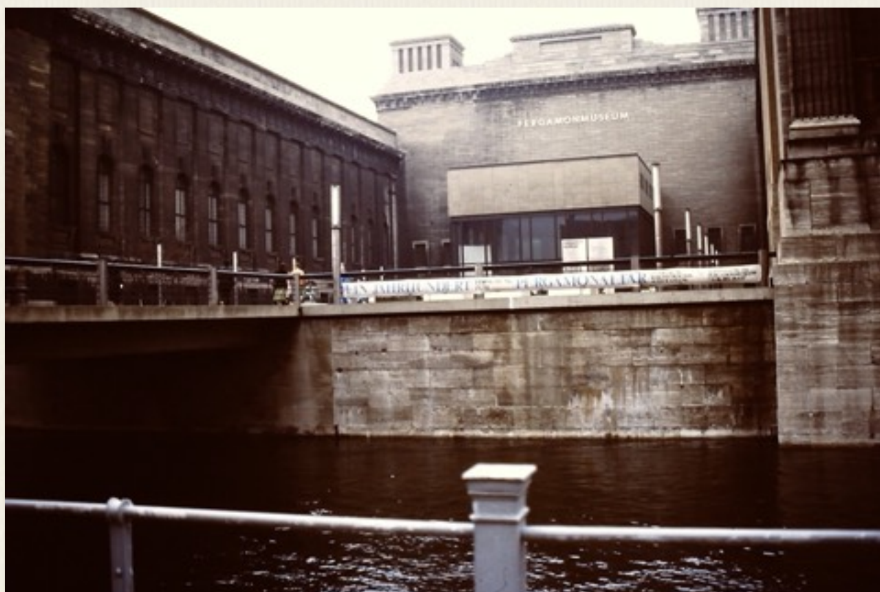
Pergamonmuseum var intakt og et besøg værd.

Tid til pause på gåturen. Øl, pølser og sodavand var meget billige, og af god kvalitet. Der var ikke engangsembalage, men pant på drikkeglassene, meget økologisk og klimavenligt.