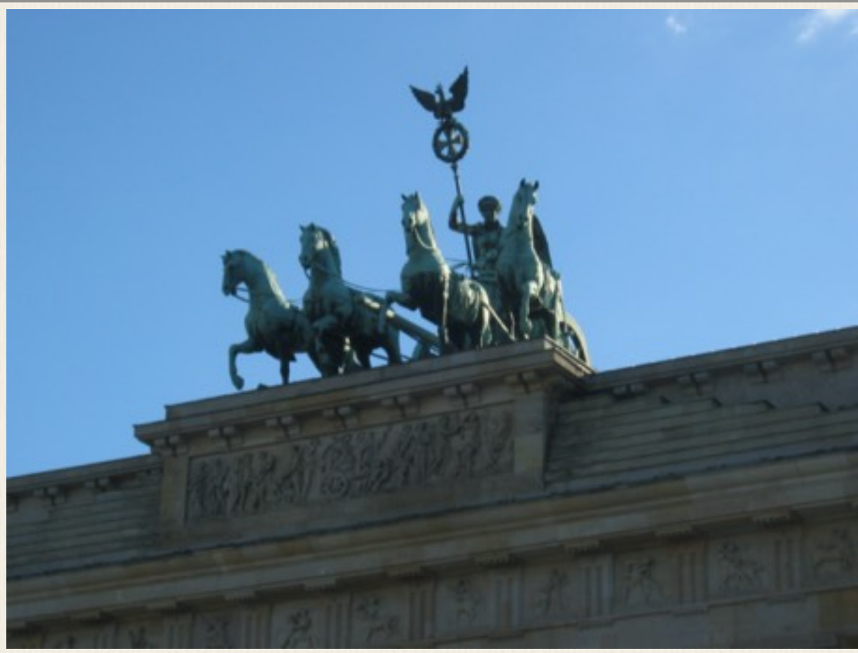
Toppen af Brandenburger Tor fotograferet i 2010.