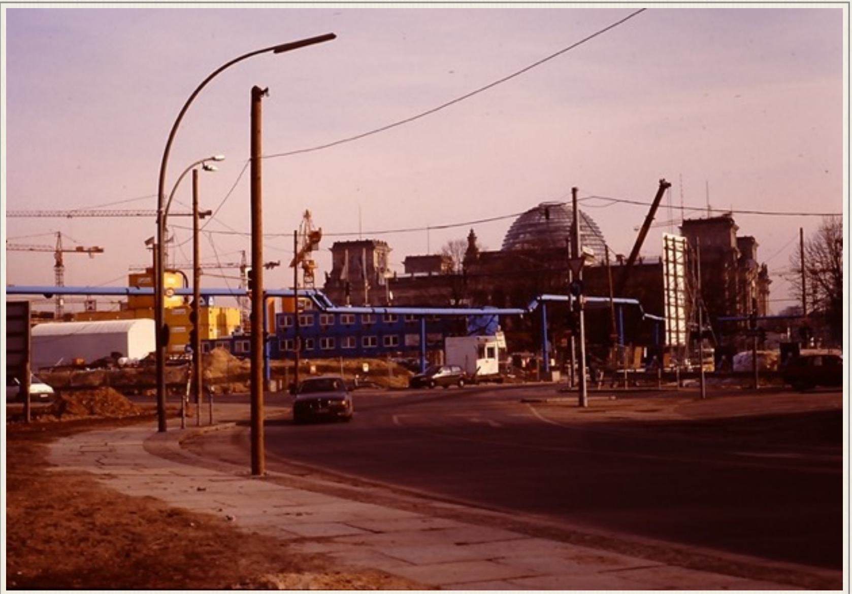
Byggeaktivitet i 1999, især i områderne, hvor muren havde stået. Genopbygningen af Rigsdagen ses også på fotoet, kuplen er kommet på, som noget nyt.

Berlin var præget af stor bygge aktivitet især i områderne, hvor Berlinmuren tidligere havde adskilt de to bydele