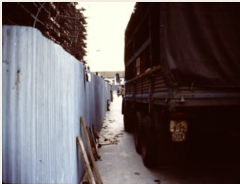
Checkpoint Charlie i 1987 set fra Østberlinsiden af Berlinmuren, da muren var der.