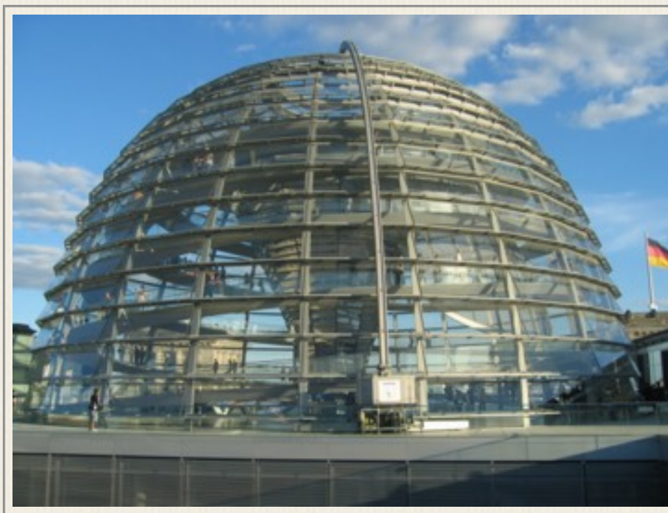
Kuplen på Forbundsstatsparlamentet i 2010.

Berlin er nu Forbundsstatsparlametsby- og regeringsby for hele det samlede Tyskland