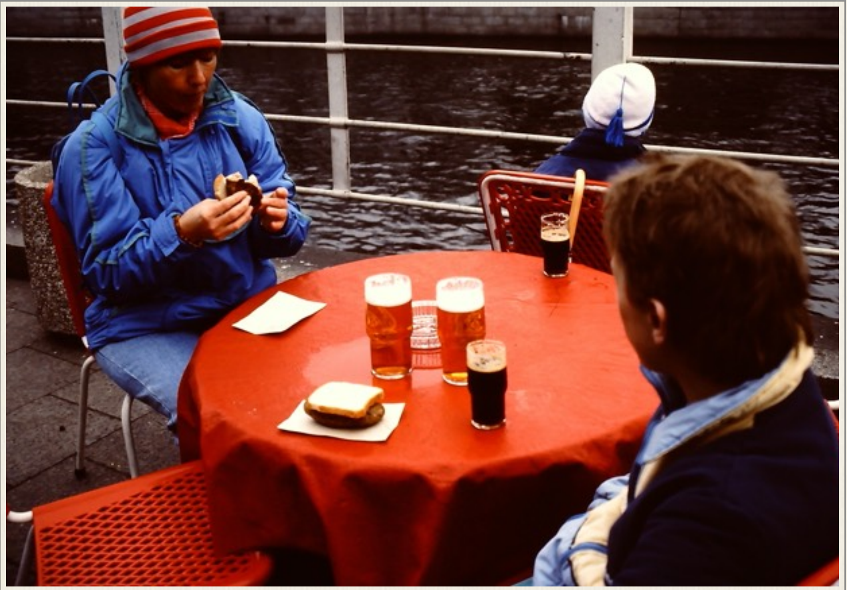
Pause i 1987 i Østberlin ved floden Spree.

Vi genfandt et lille sted fra det tidligere Østberlin, hvor vi var kommet flere gange i 1987, og havde forrettet vore nødtørfter, efter vi havde nydt den udmærkede mad vi kunne købe på gaden hos ”den østberlinske pølsemand”, som børnene kaldte ham.