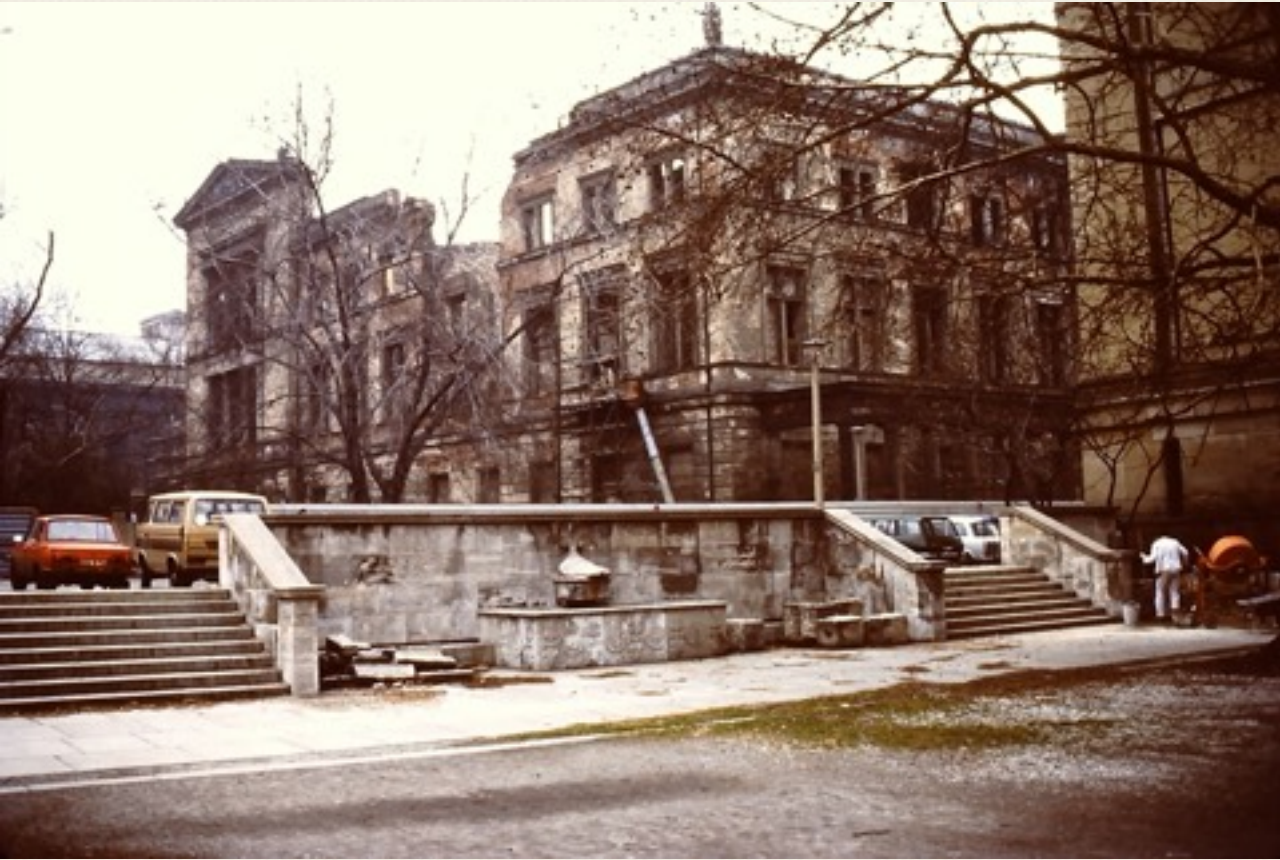
Neues Museum på Museumsinsel, som vi så det i 1987. Genopbygningen startede først i 1999. Nu er det flot genopbygget.