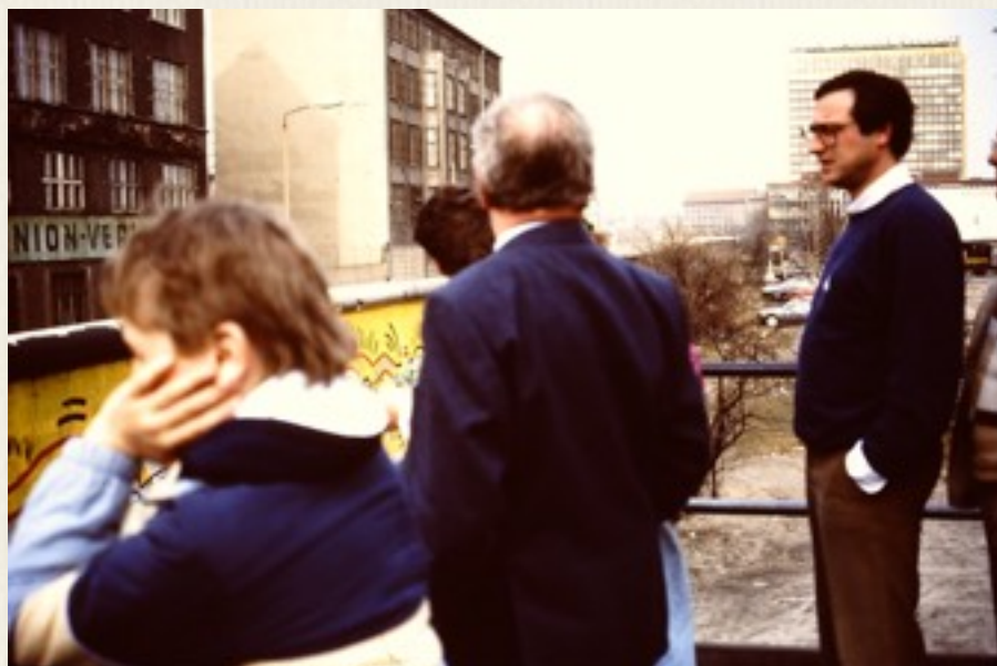
Her kikker vores søn og andre over Berlinmuren mod Østberlin.

Checkpoint Charlie, så vi på begge sider af Berlinmuren.