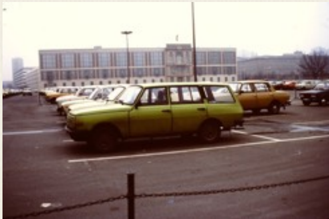
Foto fra 1987. Mange flotte østtyske biler på parkeringspladsen foran den officielle DDR-bygning i Østberlin, der husede: Staatsrat der DDR. Portalen på bygningens højre side er rester fra det gamle slot.