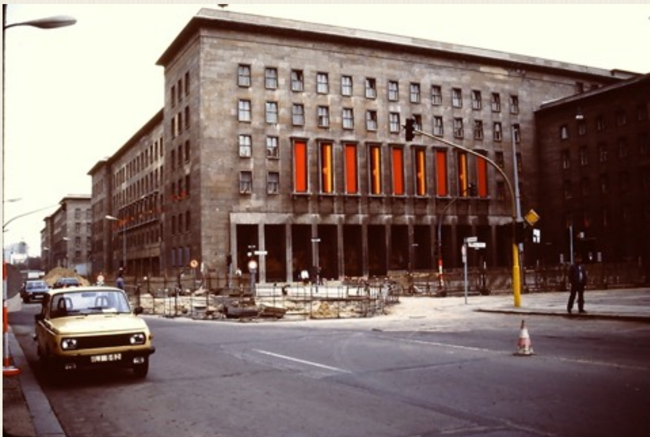
Bygningskomplekset i 1987 i Østberlin, det ses smykket af de østtyske faner.

På hjørnet af Wilhelm Straße og Leipziger Straße står bygningskomplekset, der husede Görings Luftwaffe ministerium . (10). Huset blev bygget i 1935/36 af arkitekt Ernst Sagebiel (11). Det er enormt og rummer ca. 2.000 kontorer fordelt på imponerende 56.000 m 2 . Dengang var det Berlins største kontorbygning,