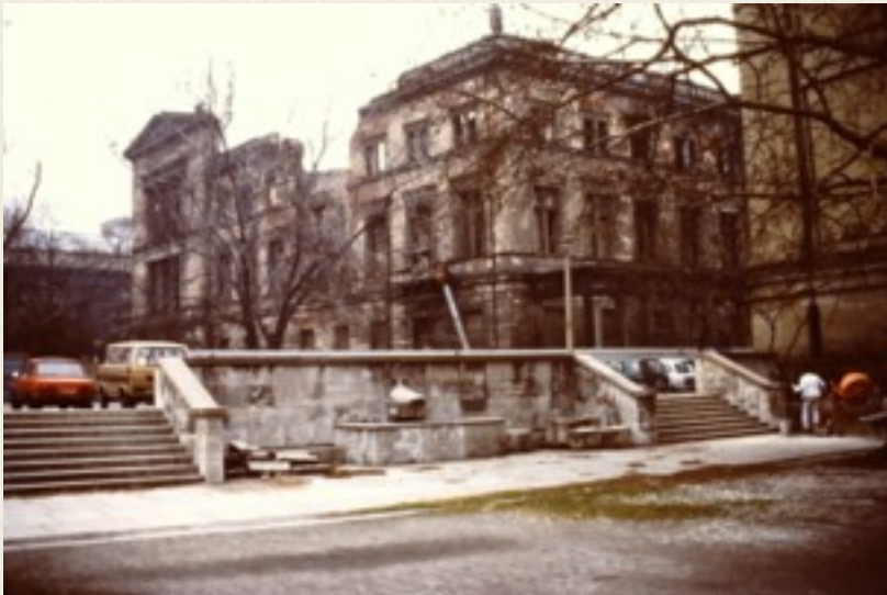
Her er Neues Museum, som vi så det i 1987, hvor det lå i ruiner.

I forbindelse med genopbygningen af Neues Museum, har man enkelte steder ladet mærkerne fra skudhullerne i muren fra 2. verdenskrig stå, og også indendørs har man ladet noget af de ødelagte vægge stå, for at mindes historien.