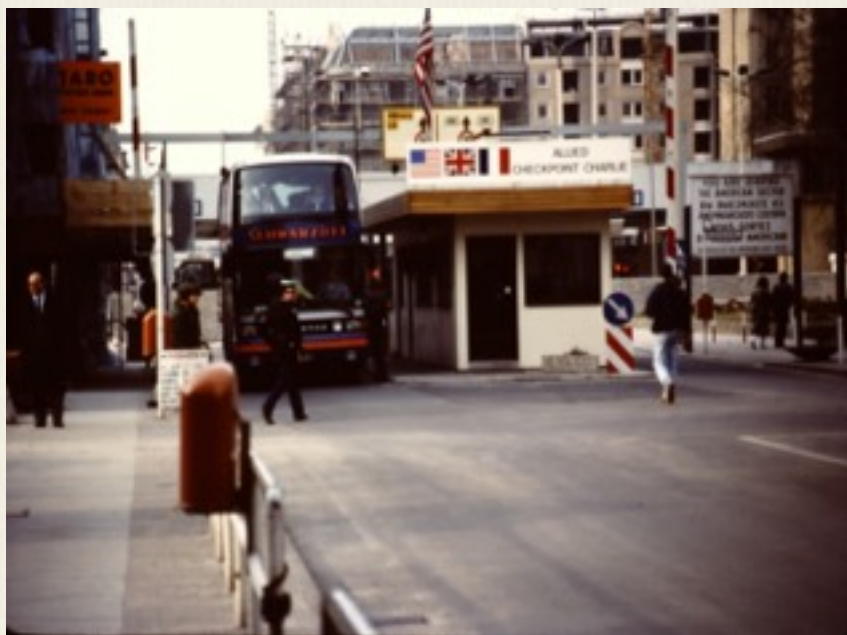
Checkpoint Charlie i 1987 set fra Vestberlinsiden af Berlinmuren, da muren var der.