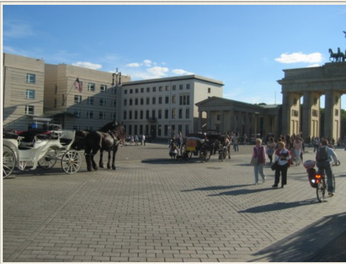
Pariser Platz i fotograferet i 2010. Brandenburger Tor ses til højre. Den amerikanske ambassade ses til venstre.