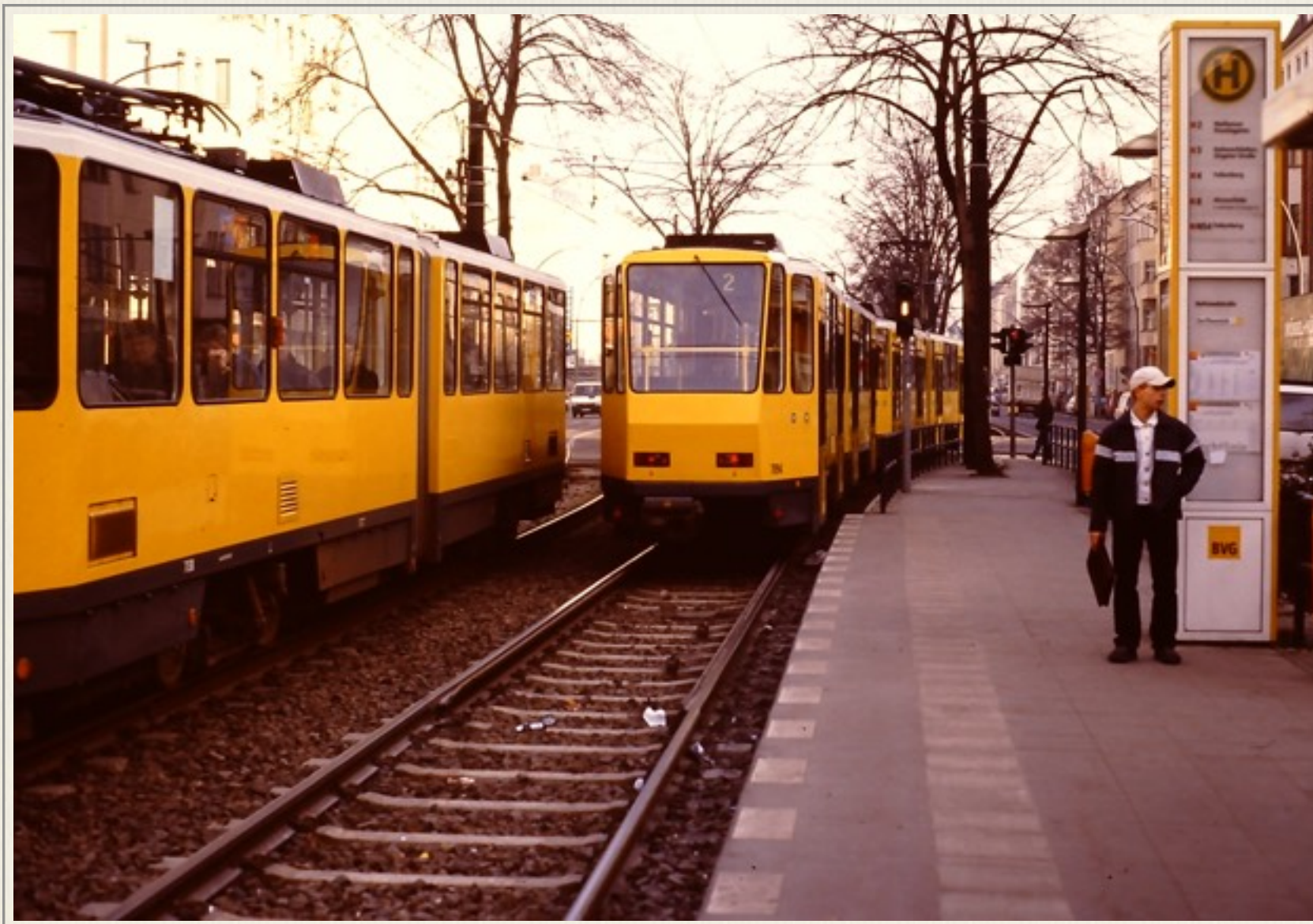
Sporvogne i det tidligere Østberlin i 1999.

For at forbedre forholdene i Østberlin og ”klinke skårene” mellem de to bybefolkninger, havde man efter min mening rakt hånden lidt ud til Østberlinerne. De havde jo mistet deres hovedstad og deres land. Eksempler på dette var, at man havde valgt, at sporvognene kunne fortsætte med at køre i det tidligere Østberlin, man havde endog sat nye sporvogne ind.