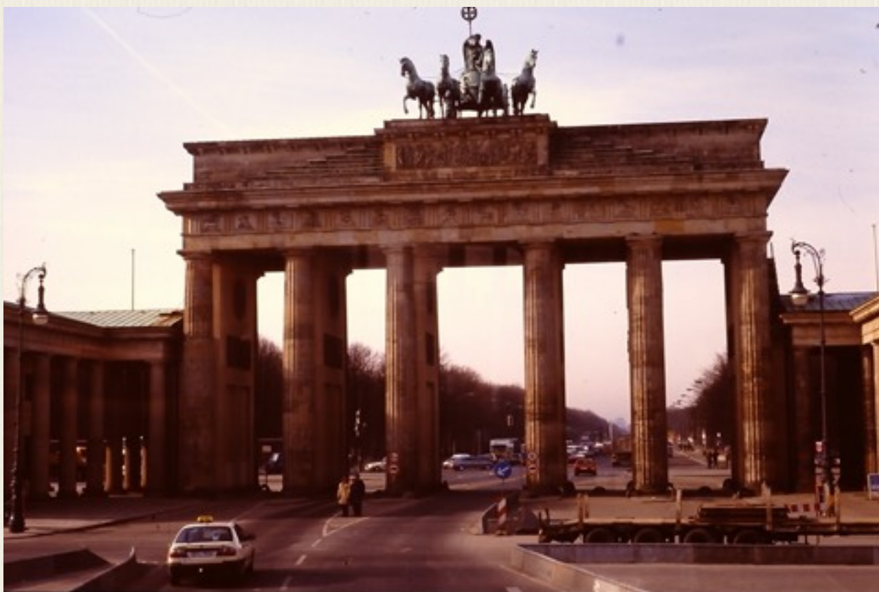
Brandenburger Tor i 1999, hvor muren er væk.