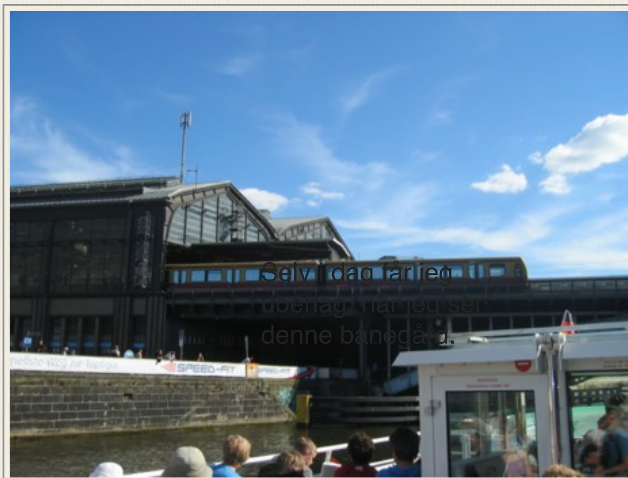
Foto fra 2010 af Friedrich Straße Bahnhof, der i 1987 var et led i Berlinmuren.

Det var jo dødsens alvor, da Berlinmuren var der!!”