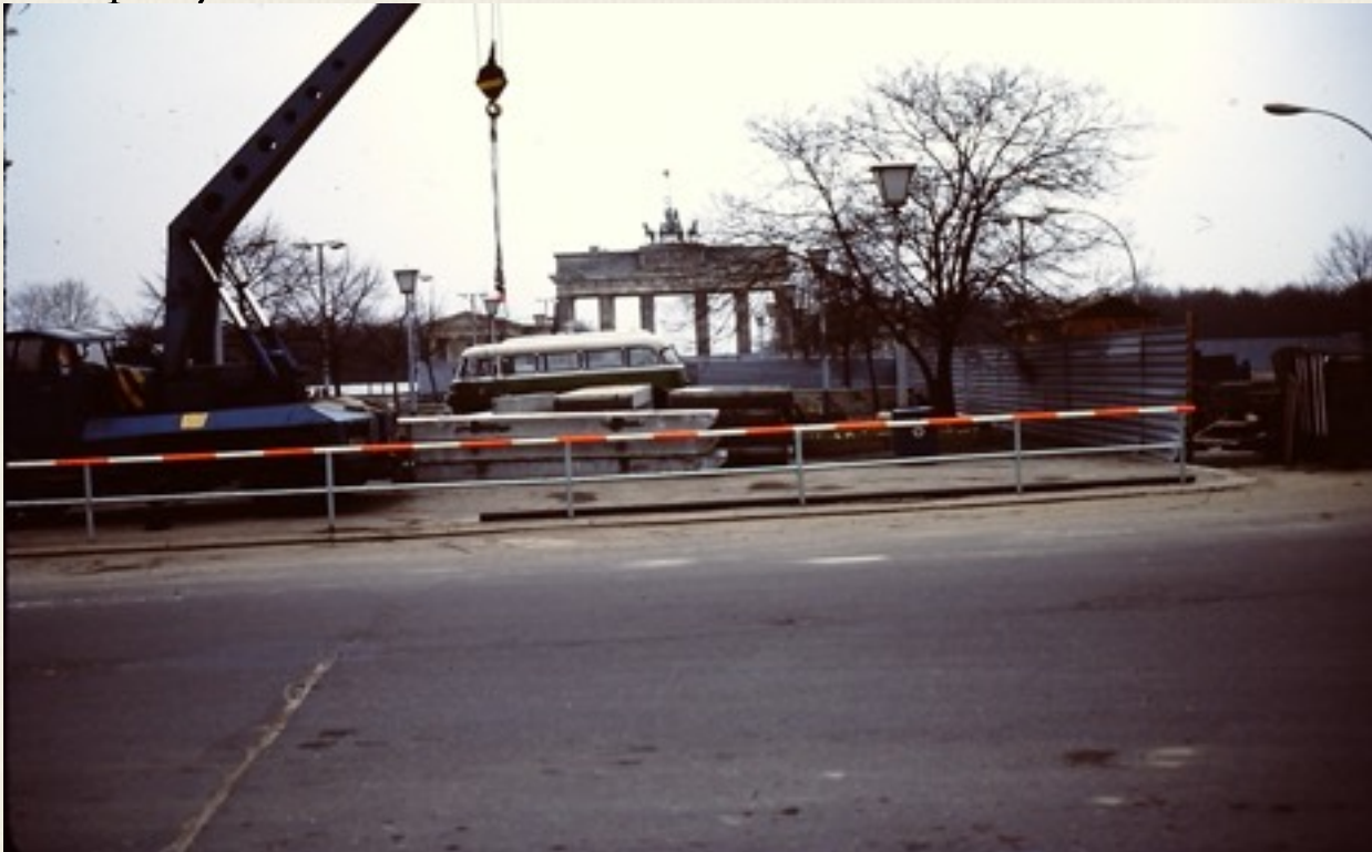
Brandenburger Tor i 1987.