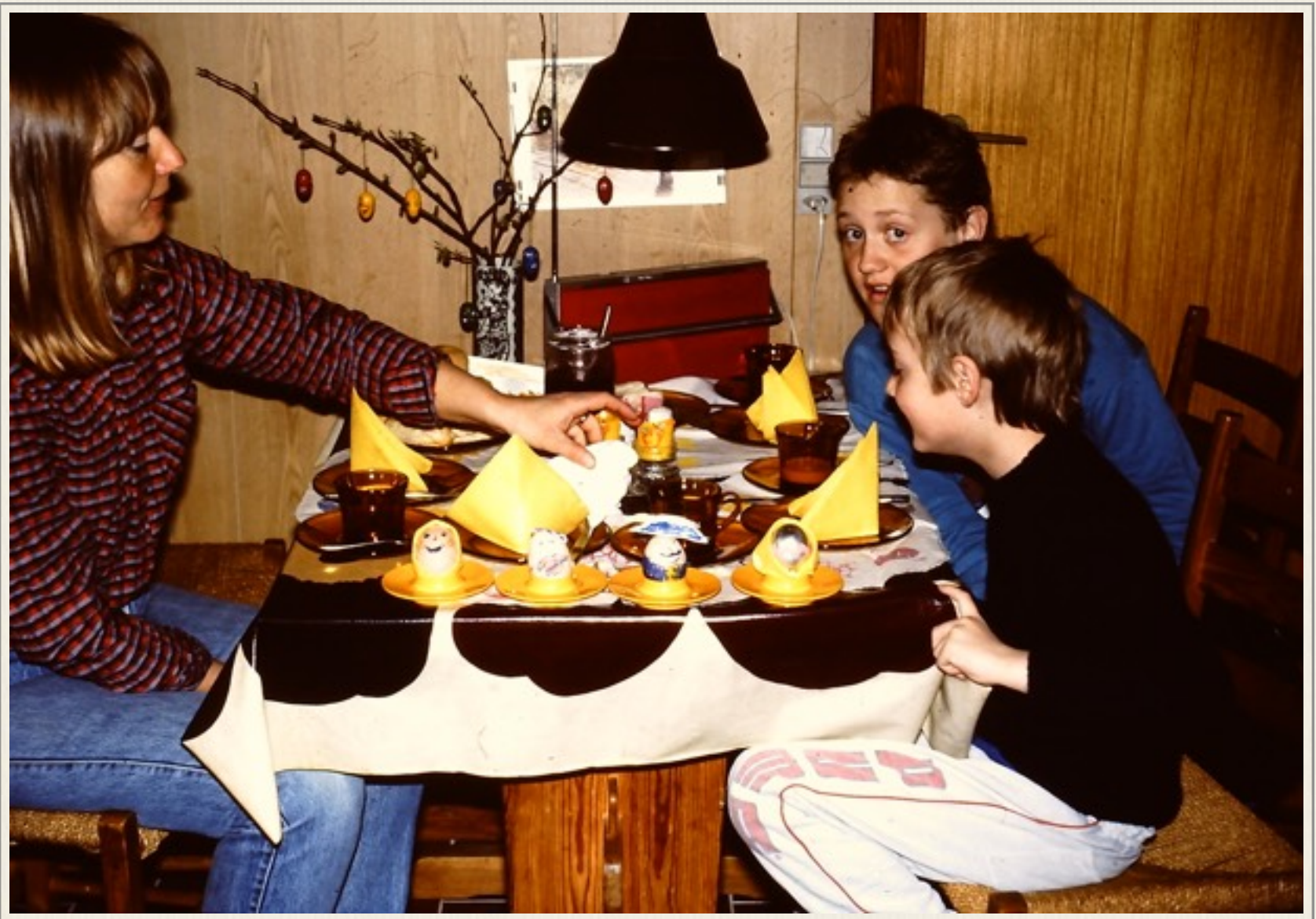
Familien i påsken 1987 taget af forfatteren hjemme i Hadsten.

Lad os starte med planlægningen, som vi foretog i 1987, for i det hele taget at få lov til at kunne køre i vores egen bil til Østberlin.