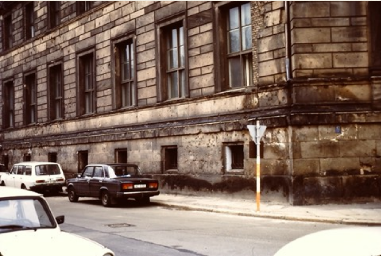
Et gadehjørne, hvor vi tydeligt kunne se skudhullerne fra 2. verdenskrig i muren ved de forreste kældervinduer.