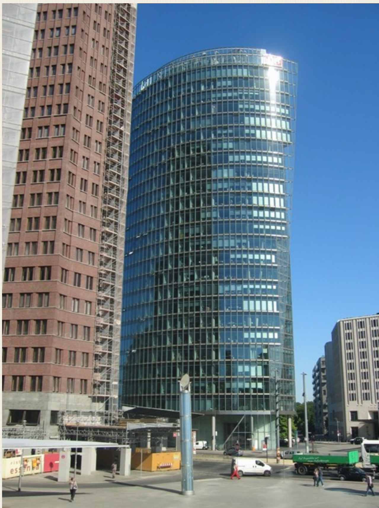
Nu bygges der skyskrabere i Berlin i 2010, hvor muren stod.