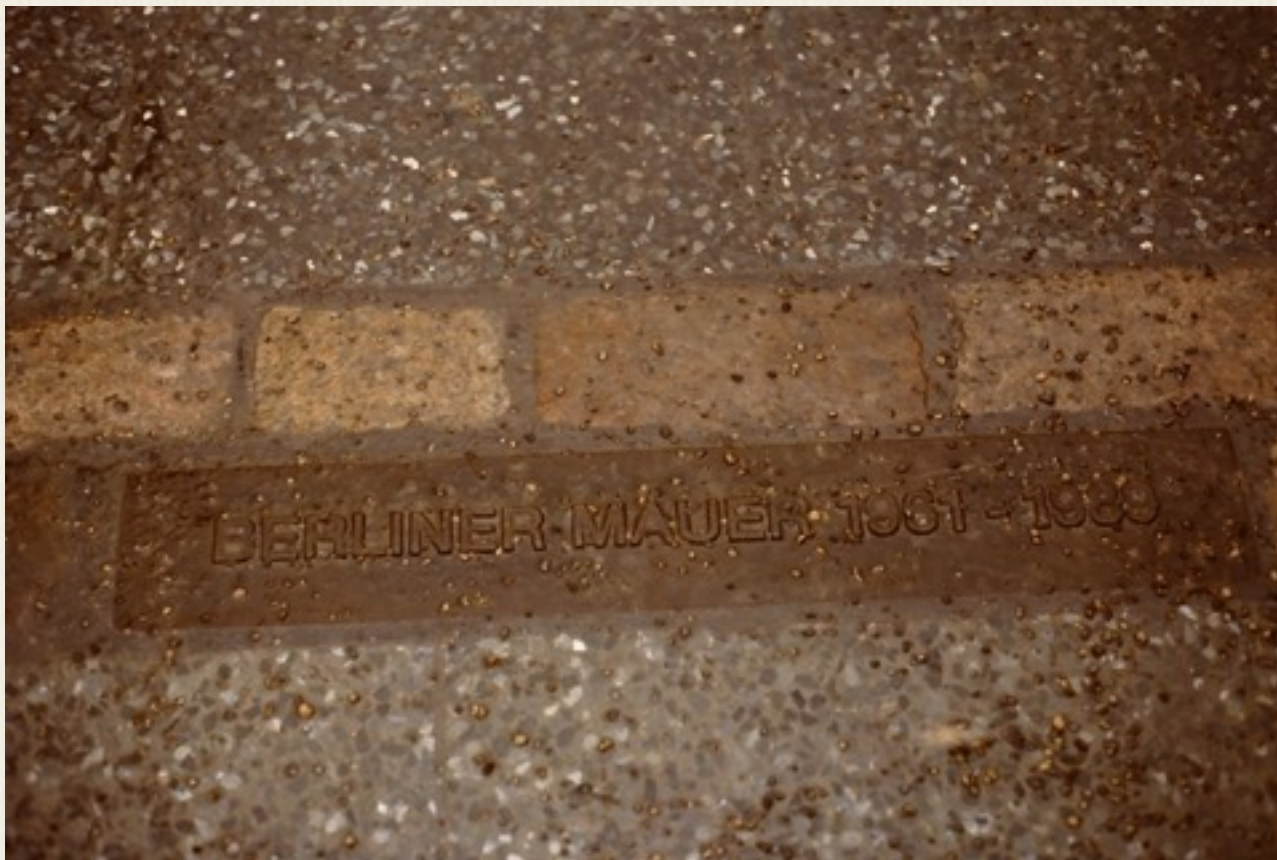
Foto af en markering i gaden, hvor Berlinmuren gik på dette sted. Pladen er svær at læse, det kan måske tolkes som Berlinmuren er ved at glemmes, nu her 30 år efter den fandtes.

Der er et ordsprog, der siger: ”Om 100 år er alting glemt”. Der er på dette tidspunkt i 2199 sikkert ikke nogen der er levende, der har oplevet Berlinmuren.