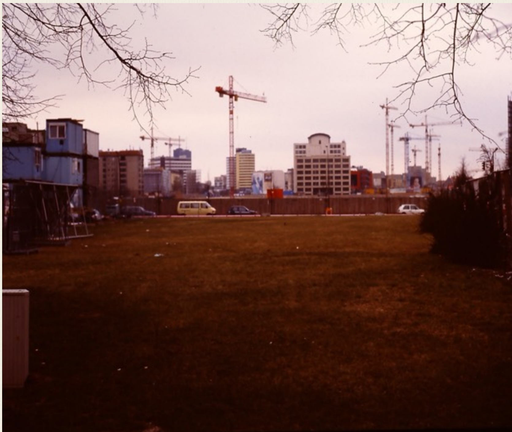
Byggeaktivitet i 1999, hvor muren havde stået.

Berlin var præget af stor bygge aktivitet især i områderne, hvor Berlinmuren tidligere havde adskilt de to bydele.