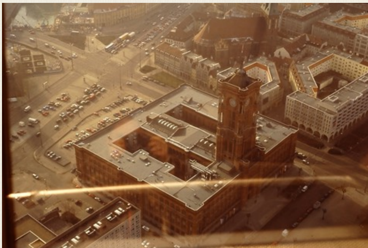
Rotes Rathaus set fra fjernsynstårnet i Berlin i 1999.

Østberlins Røde Rådhus var nu blevet hele Berlins rådhus.