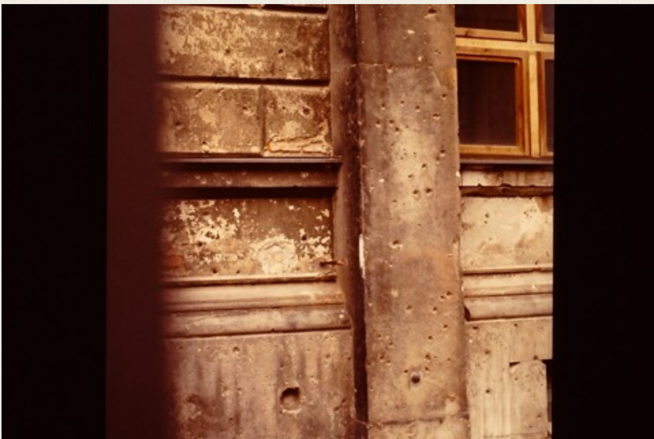
Skudhullerne fra anden verdenskrig i 1999.