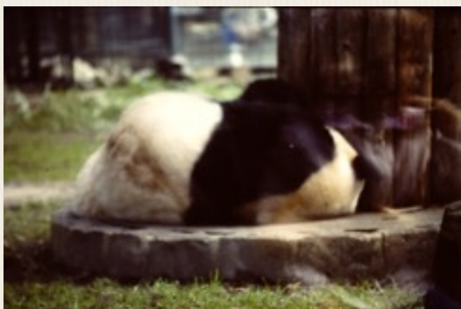
I Vestberlins zoologiske have så vi storpandaen i 1987.

Vi stod af toget i Vestberlin på Bahnhof Zoo.