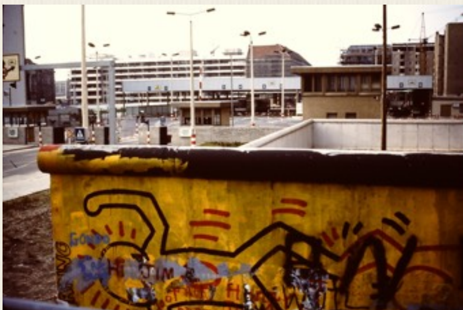
Berlinmuren i Vestberlin var let at kende, da den her var graffitimalet.