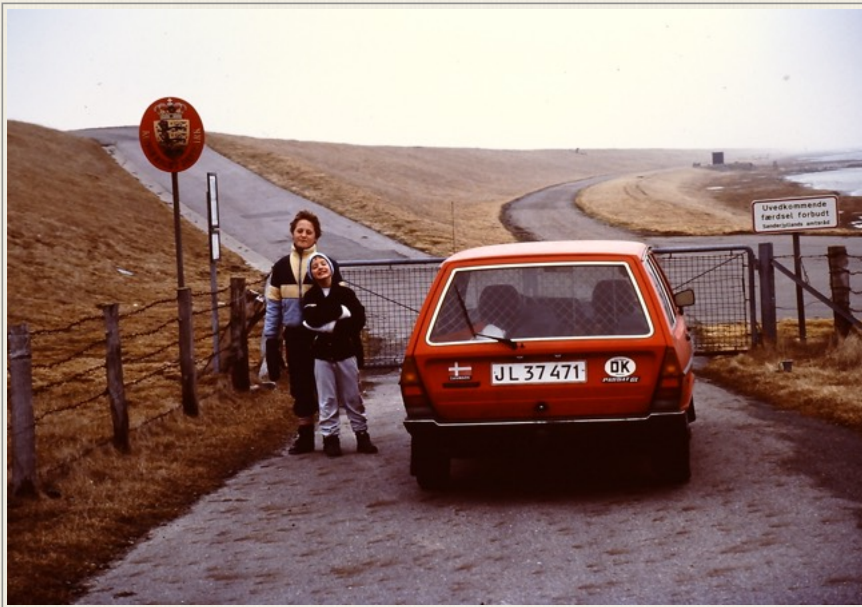
Vores børn- og bilen ved den Dansk /Vesttyske grænse i 1987 ved Højerdiget.

”Jamen! Det ved jeg og min familie, da langt mere om!”